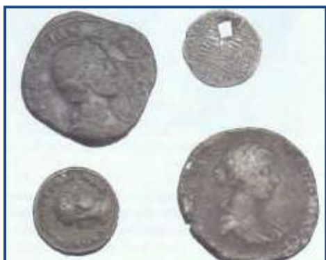
Nálezy římských mincí z Chotěbořska

Území Chotěboře mělo vždy drsné podnebí, a proto zůstávalo v dávné minulosti neosídleno. Teprve v neolitu sem občas zavítali první lidé.