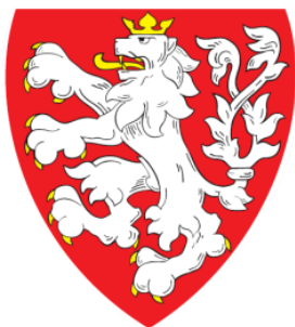
Znak města Chotěboř

Kolem roku 1329 koupil Chotěboř český král Jan Lucemburský. Ten 2. srpna 1331 udělil obci jihlavské městské právo a povýšil tak oficiálně Chotěboř na město. 16. srpna 1331 doplnil král uvedené právo např. o právo vařit pivo.