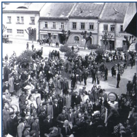
Válka skončila - shromáždění občanů na náměstí v Chotěboři v květnu 1945

Osmého května večer bylo oznámeno městským rozhlasem, že město opustily všechny posádky a jediným útvarem, který zde dočasně ještě zůstal, je vojenský lazaret. 9. května obsadila sovětská armáda Německý (nyní už Havlíčkův) Brod a její oddíly se začaly přesunovat směrem na Čáslav. Německé jednotky ustupovaly po obsazení Brodu Rudou armádou přes Chotěboř. Útěk Chotěboří nastal kolem deváté ráno. Němci prchali auty v různých směrech a snažili se uniknout před sovětskými jednotkami i za cenu palby na kohokoliv, kdo jim stál v cestě. Tak zahynuli tři další lidé z Chotěbořska těsně před úplným koncem války.