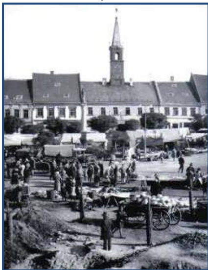
Jarmark na náměstí v Chotěboři v roce 1931

Důležitou roli hrála i v meziválečném období v hospodářském životě města řemeslná malovýroba. V provozu zůstaly také dva mlýny- Dolní mlýn a mlýn v Rochňovci. Další příležitosti poskytovalo stavebnictví. V Chotěboři působily dvě stavební firmy, Liškova a Krumlova.