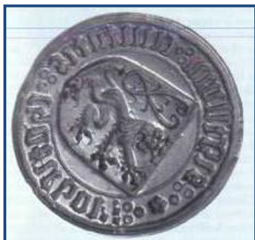
Staré městské pečetidlo ze 16. století

Rostoucí prosperitu hospodářství ve městě kladně ovlivňoval i rozvoj řemesel a obchodu. Platy a poplatky z krámů a stánků i povolování živností se totiž dělily mezi majitele panství a obec. Chotěbořští řemeslníci se v 16. století většinou sdružovali do cechovních organizací, z nichž nejvýznamnější byl cech soukenický, který už v roce 1542 obdržel od města pro své tovaryše cechovní řád. Výroba sukna měla v Chotěboři tradici a byla stále rozšiřována a zdokonalována. K významným a početným cechům ve městě patřili také tkalci, obuvníci, řezníci, mlynáři a pekaři.