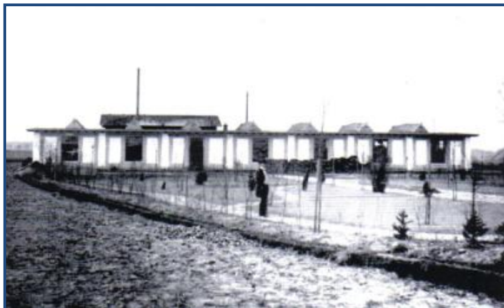
Textilní továrna firmy Klazar (1909)

Těsně před 1. světovou válkou existovaly tedy v Chotěboři celkem 4 tkalcovny, 2 vlasové závody, 1 koželužna, 1 pivovar, 1 tiskárna, 1 parní pila a 4 stavební firmy se třemi cihelnami. Chotěboř patřila až do I. světové války k průmyslově nevyspělým městům a regionům, stejně jako většina měst na Českomoravské vrchovině.